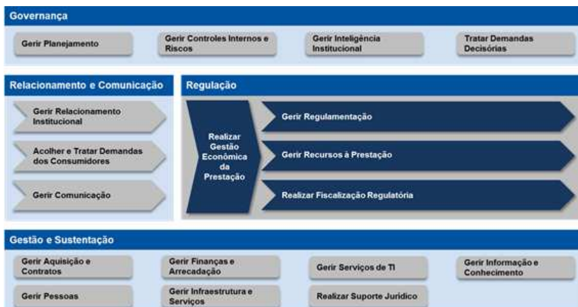
Figura 1 - Nova Cadeia de Valor da Anatel

Com base no mapeamento e análise da arquitetura de processos, o trabalho da Consultoria teve foco na melhoria dos processos, baseado nas melhores práticas identificadas durante o benchmarking internacional, com o envolvimento das áreas de negócio e da alta administração. Portanto, a implementação destes novos processos de trabalho deverá imprimir importante transformação na forma de atuação da Agência, sendo vislumbrados importantes ganhos de eficácia, eficiência e efetividade. Em função disso, são projetos que apresentaram elevada motricidade porque alavancam processos e projetos de toda agência, catalisando, portanto, o atingimento de um elevado número de objetivos estratégicos.